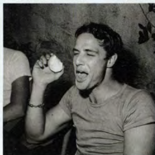
EN MARZO... UNA REVISTA PARA COMÉRSELA